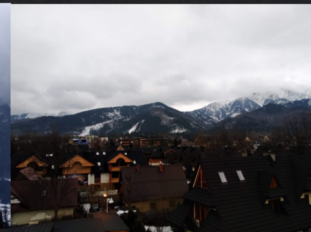
Zakopane - Montagnes au sud de la Pologne