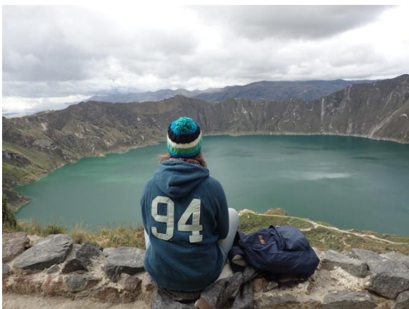
QUILOTOA SPLENDEUR LAGUNE À 3850M D'ALTITUDE, C'EST UNE DES PREMIÈRES CHOSES QUE J'AI VU SUR INTERNET EN TAPANT "EQUATEUR". ET QUELLE BEAUTÉ... ACCESSIBLE EN BUS DEPUIS LA VILLE DE LATACUNGA, ON PEUT Y DESCENDRE À PIED EN PEU DE TEMPS, LA REMONTEE EST PLUS LABORIEUSE À PAREILLE ALTITUDE...

Voici quelques photos qui parleront mieux d'elles mêmes de toutes les richesses de ce pays.