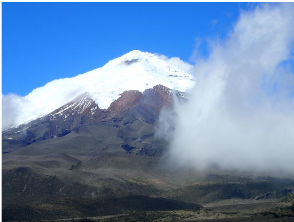
LE COTOPAXI, UN DES NOMBREUX VOLCANS D'EQUATEUR, N'HESITEZ PLUS !

N'hésitez surtout pas à me contacter à l'adresse suivante pour toute question sur ce PFE et ce voyage, je serais ravie d'y répondre : marion.veniard@mines-ales.org