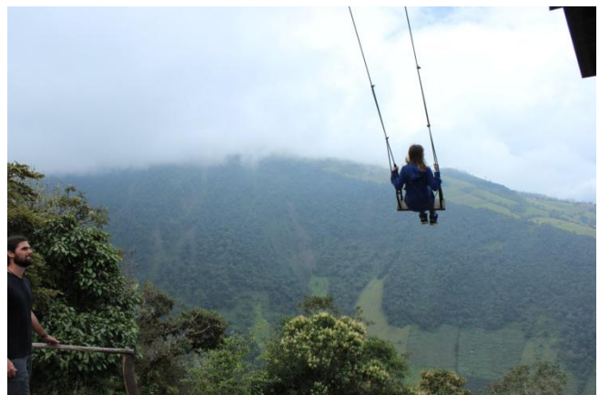
BANOS DE AMBATO ET SES ENVIRONS. PETITE VILLE CHARMANTE ENTOURÉE DE CASCADES ET DU VOLCAN TUNGURAHUA.