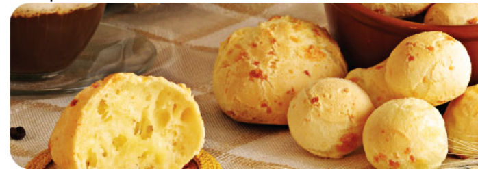
Pão de Queijo

Les plats à base de crevettes sont des spécialités de Floripa